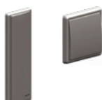
Boutons standards et du coude en version filaire ou sans fil.*